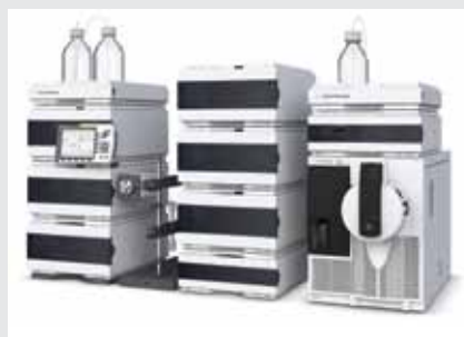
1260 Infinity 制备级液质纯化系统