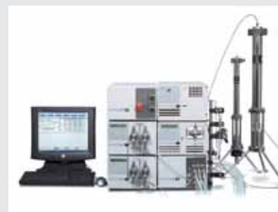
用于高通量纯化的 PrepStar SD-2 制备系统