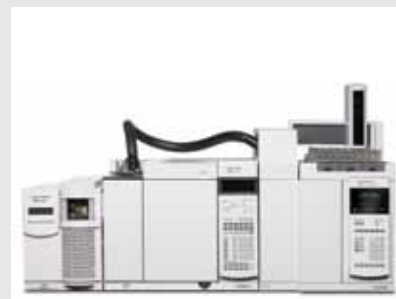
7697A 顶空进样器/7890A 气相色谱和 5975C 气质联用仪