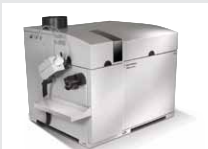
7700 系列电感耦合等离子质谱