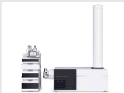
1200 Infinity 系列液相和 6500 系列精确质量数四极杆-飞行时间质谱系统