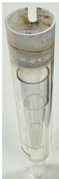
Figura 1. Desvitrificación del conjunto de tubo exterior de cuarzo después de 24 horas de análisis de una solución de Li, Na y Cs con un 1,5 % de SDT en \text{HNO}_3 al 5 %.

Los conjuntos de tubos de cuarzo están formados por cuarzo fundido (o sílice fundida), que es un cristal amorfo producido a partir de dióxido de silicio ( \text{SiO}_2 ) de alta pureza. Al exponerse a los iones de metales alcalinos a altas temperaturas, el cuarzo reorganiza su estructura molecular y se rompen los enlaces Si-O. La desvitrificación se produce cuando los iones foráneos penetran en el cuarzo y “desbloquean” esa estructura al sustituir o romper los enlaces Si-O, lo que da lugar a una estructura frágil. Tras la desvitrificación, el cuarzo se vuelve de un color blanco u opaco (Figura 1), con multitud de pequeñas grietas en la capa superficial, lo que reduce drásticamente la claridad óptica, la resistencia mecánica y la vida útil. Esta degradación es en gran parte irreversible. La limpieza de la antorcha puede mejorar su aspecto, pero la desvitrificación seguirá produciéndose. Al final, el cuarzo se agrietará o se romperá, por lo que deberá sustituirse la pieza.