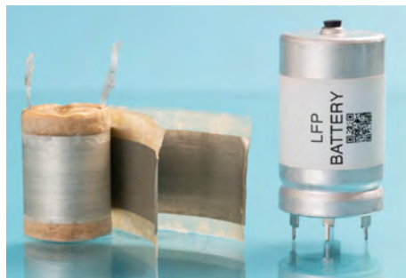
Figura 3. Tecnología de baterías.

A medida que la fabricación de baterías de iones litio y de otro tipo se acelera en todo el mundo, la investigación continúa impulsando el desarrollo de tecnologías para baterías más seguras y duraderas. En este sector, el sistema de ICP-OES de Agilent juega un papel clave en la cadena de valor de las baterías.