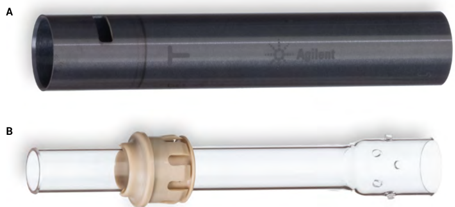
Figura 6. Tubo exterior cerámico (A) y tubo interior de cuarzo (B) del conjunto de tubos de Agilent.

exterior cerámico (fabricado con nitruro de silicio) puede reducir la lixiviación de Si de la antorcha, lo que mejora el límite de detección (Figura 5).