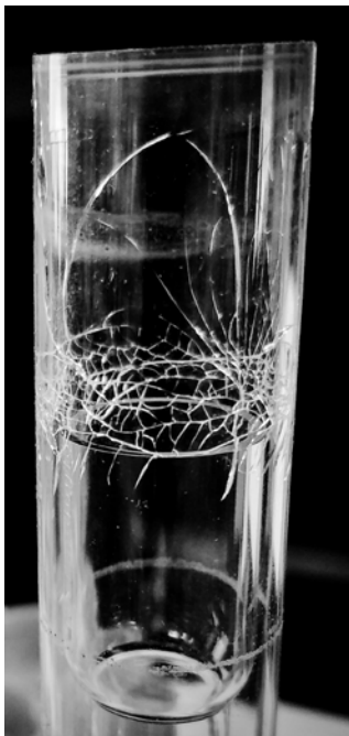
Figura 4. Agrietamiento en forma de telaraña en un recipiente de cuarzo.

(UV) profunda generada por la alta temperatura del plasma. Las impurezas del cuarzo como, por ejemplo, los metales, absorben la energía UV, lo que desencadena la desvitrificación localizada. Estos efectos debilitan la superficie del cuarzo, lo que provoca un agrietamiento en forma de telaraña (Figura 4) cuando la antorcha se calienta y se enfría. Esto reduce su vida útil.