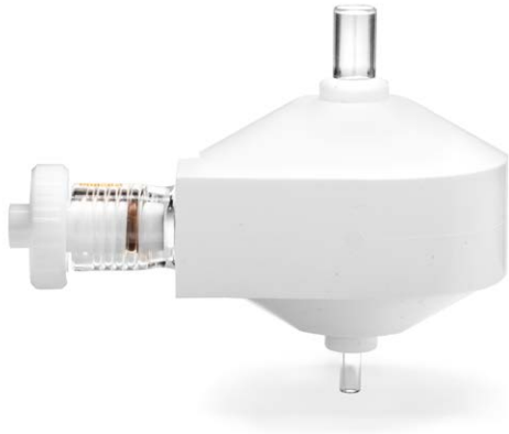
그림 2. 분리 가능한 유리 더블 패스 스프레이 챔버는 쉽게 세척할 수 있는 열 전도성 폴리머 층으로 덮여 있습니다.

IsoMist는 세척 및 일상적인 유지보수를 위해 쉽게 분리할 수 있는 견고하고 콤팩트한 유닛입니다.