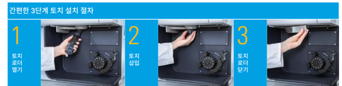
그림 2. 간단한 3단계 순서로 빠른 시작과 재현성 있는 성능을 위해 토치를 기기에 로드합니다.

5900 및 5800 ICP-OES에는 Easy-Fit 토치가 장착되어 있으며, 토치를 자동으로 정렬하고 가스를 연결하여 빠른 시작과 재현성 있는 성능을 보장하는 단순한 토치 장착 메커니즘을 갖추고 있습니다(그림 2). 토치가 장착된 이후에는 토치를 추가적으로 조정하거나 axial 관측 위치를 광학적으로 정렬할 필요가 없습니다. 이러한 자동 정렬 기능은 작업자 간에 재현성 있는 성능을 요구하는 실험실에 매우 중요하며 기기 간 가변성도 크게 줄여줍니다. 최고의 안정성을 위해 Mass Flow Controller(MFC)가 토치로 유입되는 모든 플라즈마 가스 흐름을 제어합니다.