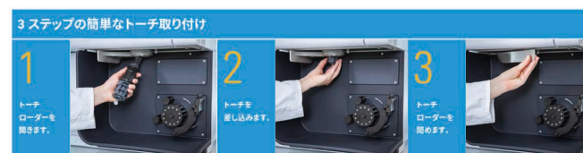
図 2. 簡単な 3 ステップでトーチの取り付けが完了します。すばやく分析を開始し、一貫した性能を確保することができます。

5900 および 5800 ICP-OES には、イーजीフィットトーチが搭載されています。また、シンプルなトーチローダーメカニズムにより、トーチが自動的に正しい位置にセットされ、ガスに接続されるため、分析をすばやく開始でき、性能にばらつきが生じることもありません（図 2）。いったんロードすれば、トーチのアライメントやアキシシャルビューの観測位置の光学アライメントは必要ありません。この自動アライメントは、オペレーター間に高い再現性が要求されるラボにとってきわめて有益な機能であり、機器間のばらつきも大幅に低減できます。また、マスフローコントローラ（MFC）により、トーチに送られるすべてのガス流量がコントロールされるため、安定性が最大限に高まります。