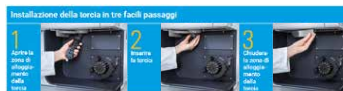
Figura 2. Sequenza di tre semplici passaggi per caricare la torcia nello strumento per un avvio rapido e prestazioni riproducibili.

I sistemi ICP-OES 5900 e 5800 sono dotati di torcia Easy-fit e di un semplice meccanismo di alloggiamento che allinea la torcia e collega i gas automaticamente per un avvio rapido e prestazioni riproducibili (Figura 2). Una volta caricata non necessita di ulteriori aggiustamenti, né allineamenti ottici della posizione assiale. L'allineamento automatico è l'ideale per i laboratori che necessitano di prestazioni riproducibili da operatore a operatore e riduce drasticamente la variabilità da strumento a strumento. I controlli del flusso di massa (MFC) controllano tutti i flussi di gas plasma in entrata nella torcia per garantire massima stabilità.