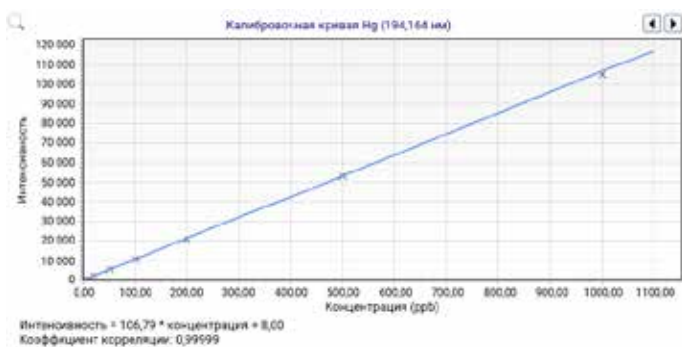
Рис. 4. Калибровочная кривая для линии Hg 194,164 нм, полученная на ИСП-ОЭС Agilent 5900 SVDV с системой MSIS в режиме генерации летучих гидридов.