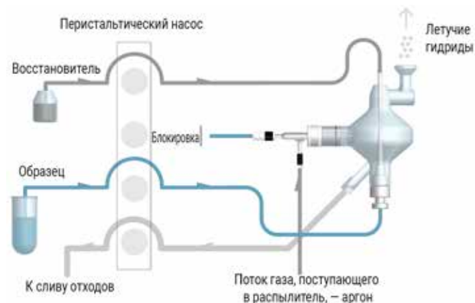
Рис. 2. Режим генерации летучих гидридов.

В этом режиме трубка подачи пробы к распылителю блокируется и проба начинает подаваться в нижнюю часть распылительной камеры. Восстановитель подается в верхнюю часть распылительной камеры. При смешивании пробы и восстановителя образуются летучие гидриды. Затем они переносятся потоком аргона из распылителя в плазму для анализа.