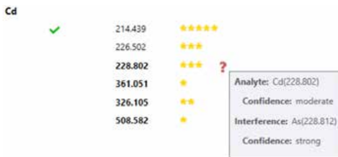
Figura 2. IntelliQuant indica la lunghezza d'onda migliore per l'analita con un alto numero di stelle e un segno di spunta verde. Inoltre, se sospetta la presenza di interferenze, le evidenzia assegnando un basso numero di stelle alle lunghezze d'onda interessate dell'analita. Per identificare le potenziali sovrapposizioni spettrali è possibile passare il mouse sul punto di domanda rosso.

Una volta che un campione è stato misurato con IntelliQuant, la funzionalità di classificazione a stelle fornisce un elenco delle migliori lunghezze d'onda da usare per l'analisi di ogni elemento presente nel campione. La classificazione a stelle assegnata a ciascuna lunghezza d'onda aiuta, inoltre, a identificare gli interferenti, come mostrato in Figura 2. Determinando se un potenziale elemento interferente è presente o meno in un campione, IntelliQuant semplifica nettamente la scelta della lunghezza d'onda da usare nei report o da impiegare per regolare un metodo quantitativo. Inoltre, gli utilizzatori possono evitare di riportare risultati che sono affetti da interferenza.