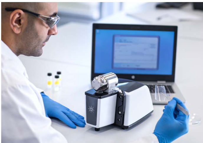
图 3. DialPath 附件可用于测量聚合物薄膜