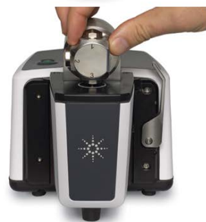
图 2. 液体样品分析。使用 DialPath 附件进行分析的三个步骤