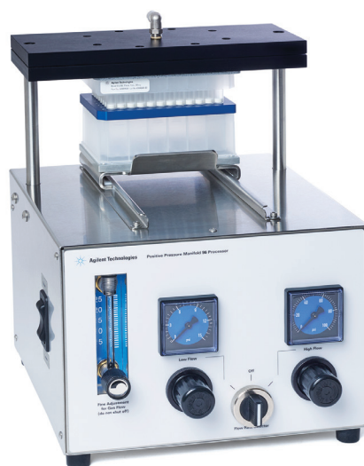
図 2. 加圧式マニホールド SPE カートリッジ 96 本用