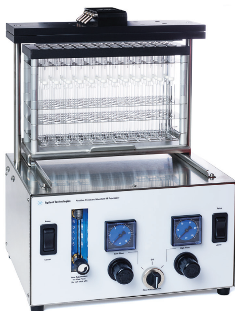
図 1. 加圧式マニホールド SPE カートリッジ 48 本用

PPM-48 と PPM-96 は、あらゆるラボに簡単に導入できます。モジュラ型ラックは、カートリッジとコレクションラック (PPM-48) または 96 ウェルプレートとコレクションプレート (PPM-96) を単純に積み重ねる形式です。カートリッジとコレクションラックは、スライドプラットフォーム上に互いが 1 方向のみで適合するように物理的に固定されています。これにより、プラットフォーム移動時の安定性が保証され、ラック方向を間違える可能性が低くなります。加圧式マニホールドは、異なるサイズの 96 ウェルプレート、カートリッジ、試験管、およびオートサンプリャルにも対応するように自動調整されるため、スペーサを追加する必要はありません。この機能により、Agilent PPM 加圧式マニホールドはサンプル処理における容易で効率的な手法といえます。