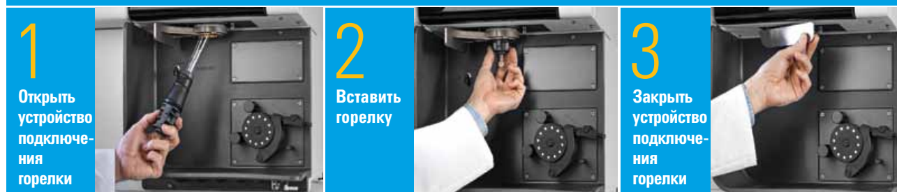
Рис. 2. Последовательность из трех простейших операций для подключения горелки к прибору и обеспечения быстрого запуска и высокой воспроизводимости