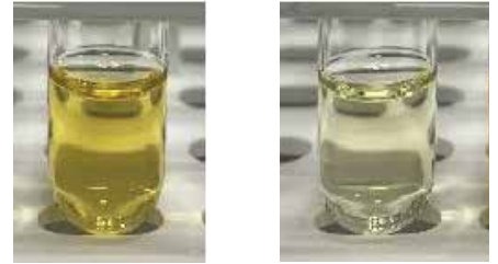
図 2. タバコ抽出物：クリーンアップなし (左)、Agilent Captiva EMR-LPD クリーンアップ実施後 (右)