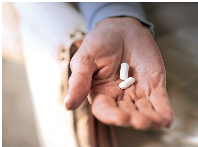
图 2. 药物制剂日新月异

自动或半自动方法可以充分发挥分析设备的性能，可以在正常工作时间之外无人值守地完成大量工作。如果测试的运行时间长达一两天，那么我们就可以选择自动处理。