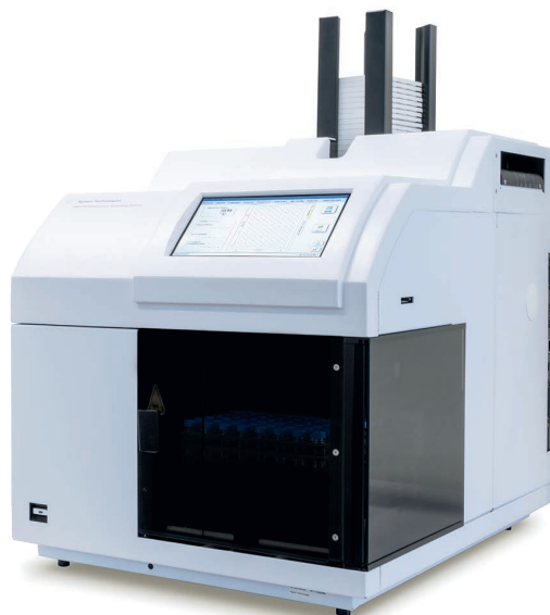
图 4. Agilent 850-DS 取样工作站

您可能注意到了过滤板有些许改动。但过滤板仅是名称改变，而质量依旧。GE Whatman 现在更名为 Cytiva。