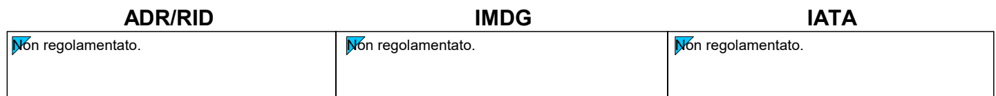
Tabella dei contenuti