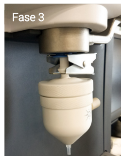
Figura 4. Installazione della camera di nebulizzazione inerte sulla torcia inerte MP-AES.