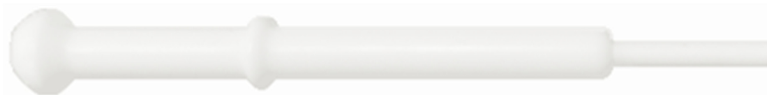
Figura 1. Accoppiatore a giunto sferico in PTFE e gruppo iniettore utilizzati con la torcia inerte completamente smontabile. La torcia inerte semi-smontabile include un analogo accoppiatore a giunto sferico in PTFE insieme al gruppo iniettore che è fissato in posizione nel corpo della torcia.