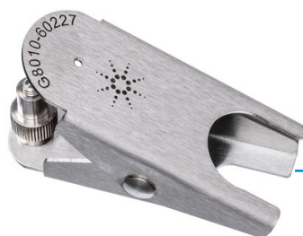
La fessura più ampia si inserisce nella scanalatura alla base della torcia inerte