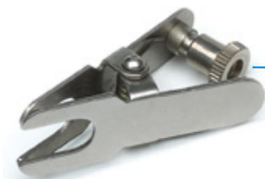
Dado di bloccaggio

SUGGERIMENTO Girare il dado di bloccaggio presente sul morsetto in senso orario (se necessario) per assicurarsi che ci sia spazio sufficiente per aprire il morsetto.