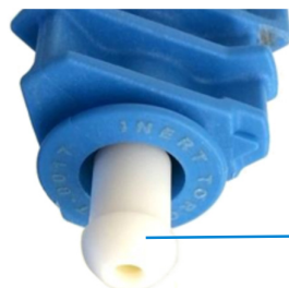
Accoppiatore sferico PTFE montato sull'estremità libera del tubo dell'iniettore in allumina