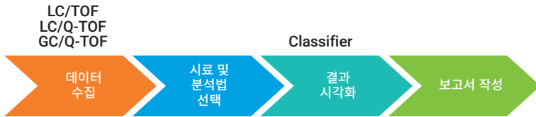
그림 2. Classifier의 자동 시료 분류

자동 시료 분류는 선형판별분석(LDA), 최소자승법 판별분석(PLSDA), 랜덤 포레스트, SIMCA(soft independent modeling of class analogies)와 같이 MPP에서 선택한 분석법을 기반으로 시료를 처리하고, 간단한 뷰로 결과를 제공하여 사용자가 시료의 진품 여부를 판단할 수 있도록 합니다.