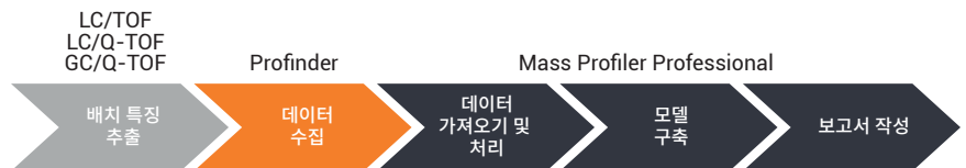
그림 1. 분석법 개발을 위한 워크플로

식품 사기(Food Fraud)에 대한 우려가 전 세계적으로 증가하고 있습니다. 식품 핑거 프린팅은 알려진 이슈에 대한 시험 방법을 개발하거나 새로운 이슈를 조사하는 임무를 맡은 실험실의 주목을 받고 있습니다. 핑거 프린팅은 몇몇 화합물에만 초점을 맞추는 시험보다 더욱 전체적인 방식으로 식품과 원료를 고찰할 수 있는 이점을 제공합니다. 따라서, 이는 위조자들이 조작하기에 보다 어려운 검사를 만들어낼 수 있습니다. Agilent MassHunter 제품군에 새롭게 추가된 Agilent MassHunter Classifier는 LC/MS 및 GC/MS 사용자가 Agilent MassHunter Profinder 및 Mass Profiler Professional(MPP)을 통해 개발한 핑거 프린팅 전략을 일변시켜, 분석가 또는 기술자에게 실행 가능한 결과를 제공하는 자동 시료 분류 보고서를 생성할 수 있도록 합니다. 그림 1은 전체 과정을 자동화하기 위한 분석법 개발 워크플로를 보여줍니다.