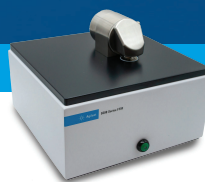
5500 紧凑型 FTIR