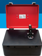
4500 便携式 FTIR