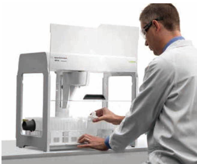
SPS 4 オートサンブラとオプションの一体型カバー。 サンプルへのアクセスが容易にできるようにフロントカバーが開いた状態で 固定されています。