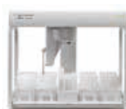
Agilent SPS 4