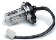
InfinityLab 长寿命 HIS 氙灯