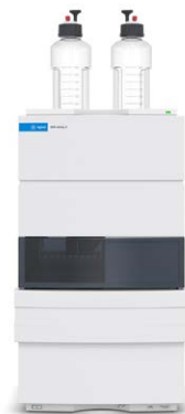
1220 Infinity II 液相色谱仪