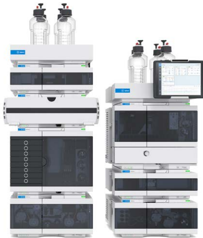
1290 Infinity II 液相色谱仪