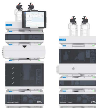
1260 Infinity II Prime 液相色谱仪