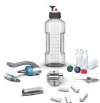
InfinityLab 启动工具包 (部分展示)