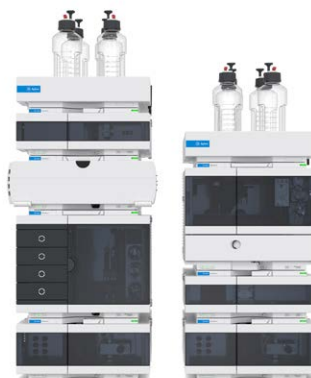
1260 Infinity II 液相色谱仪