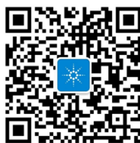
安捷伦售后服务号