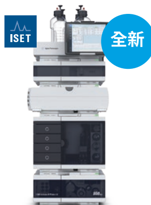
Agilent 1260 Infinity II Prime LC 效率始終如一 更多便利性