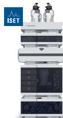
Agilent 1290 Infinity II 液相色谱仪 效率的新标杆