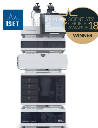
Agilent 1260 Infinity II Prime 液相色谱仪 效率始终如一 分析信心十足