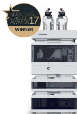
Agilent 1260 Infinity II 液相色谱仪 效率始终如一