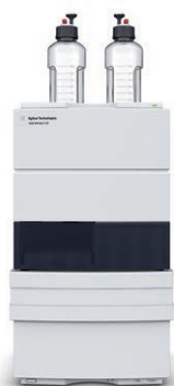
Agilent 1220 Infinity II 液相色谱仪 高效经济之选

从常规分析到前沿研究，Agilent InfinityLab 液相色谱系列提供了行业最广泛的液相色谱系列解决方案，帮助您获得最高运行效率，同时不超出预算范围。