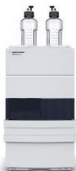
Agilent 1220 Infinity II LC Eficiência acessível

Da análise de rotina à pesquisa de ponta, a série LC Agilent InfinityLab oferece o mais amplo portfólio de soluções de cromatografia líquida, ajudando você a alcançar a mais alta eficiência operacional sem sair do seu orçamento.