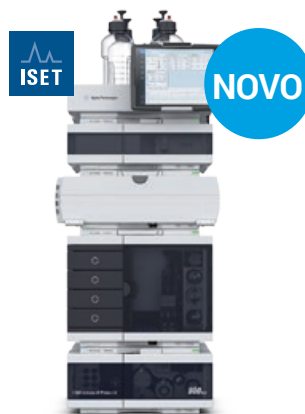
LC Agilent 1260 Infinity II Eficiência diária com mais conveniência