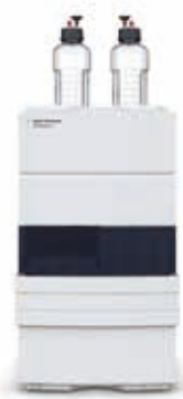
Agilent 1220 Infinity II LC 手頃な価格で 効率化を実現

ルーチン分析から最先端の研究まで、Agilent InfinityLab LC シリーズは、さまざまな液体クロマトグラフィーソリューションを提供し、ニーズに応じた最高の運用効率を支援します。