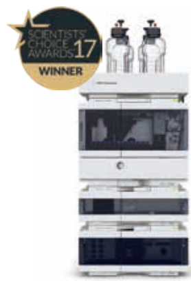
Agilent 1260 Infinity II LC 日々の分析作業を 効率化