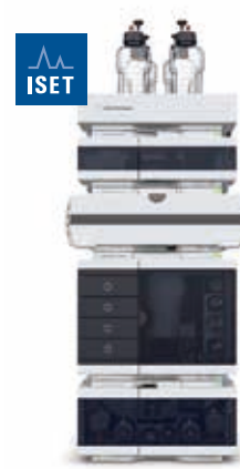
Agilent 1290 Infinity II LC 効率の 新たなスタンダード