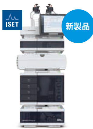
Agilent 1260 Infinity II Prime LC 分析作業の効率化と 利便性の向上