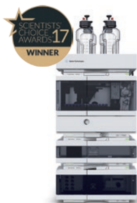
Sistema LC Agilent 1260 Infinity II Efficienza quotidiana