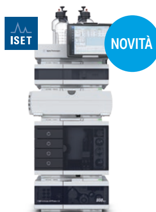
Sistema LC Agilent 1260 Infinity II Prime Efficienza quotidiana ancora più conveniente