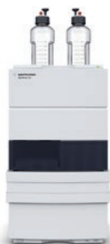
Sistema LC Agilent 1220 Infinity II Efficienza conveniente

Sia che si tratti di analisi di routine o di ricerca all'avanguardia, la serie per LC Agilent InfinityLab offre una vastissima gamma di soluzioni per la cromatografia liquida che possono aiutarti a ottenere la massima efficienza operativa senza superare il tuo budget.