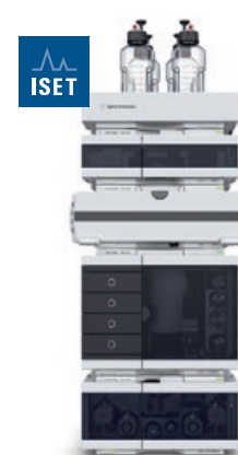
Sistema LC Agilent 1290 Infinity II Il punto di riferimento per l'efficienza