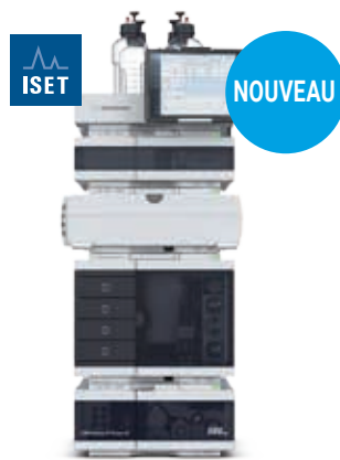
LC Agilent 1260 Infinity II Prime L'efficacité au quotidien avec plus de commodité