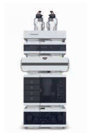
LC Agilent 1290 Infinity II La référence en matière d'efficacité