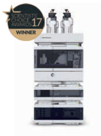
LC Agilent 1260 Infinity II L'efficacité au quotidien