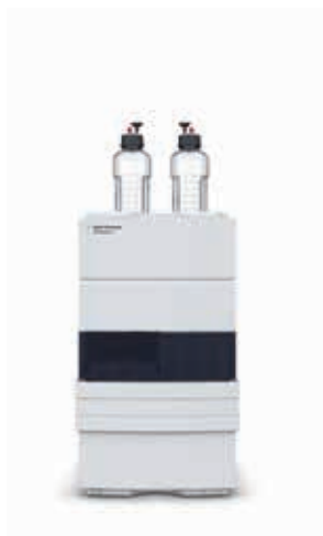
LC Agilent 1220 Infinity II L'efficacité abordable

Des analyses de routine à la recherche de pointe, la série LC Agilent InfinityLab offre la plus vaste gamme de solutions de chromatographie en phase liquide, pour vous permettre d'obtenir une efficacité opérationnelle maximale tout en respectant votre budget.