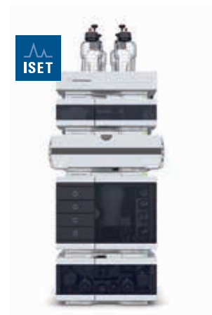
Agilent 1290 Infinity II LC

Effizienz in der täglichen Routine mit mehr Komfort