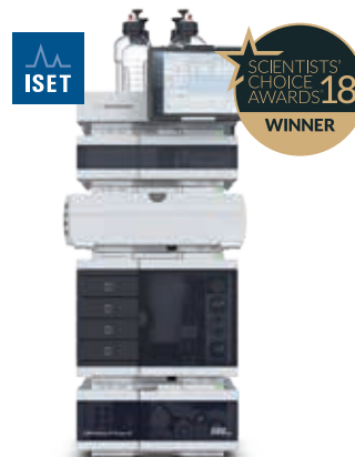
Agilent 1260 Infinity II Prime LC

Effizienz in der täglichen Routine mit mehr Komfort