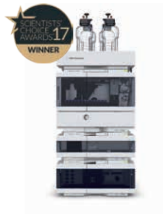
Agilent 1260 Infinity II LC