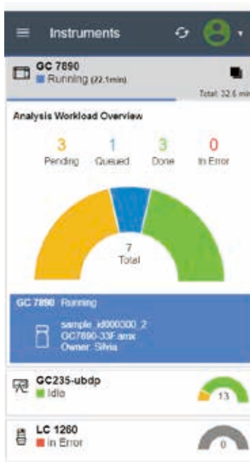
図 3. モバイルデバイスから、機器の状態や各自に割り当てられているサンプル数を確認できます。機器タイトルをクリックすると、分析中のサンプル名、取り込みメソッド、分析を担当しているユーザーなどの詳細情報が表示されます。