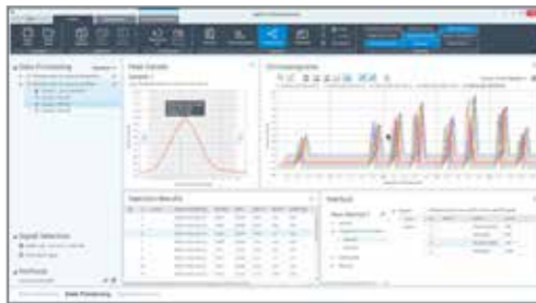
Formación con instructor virtual