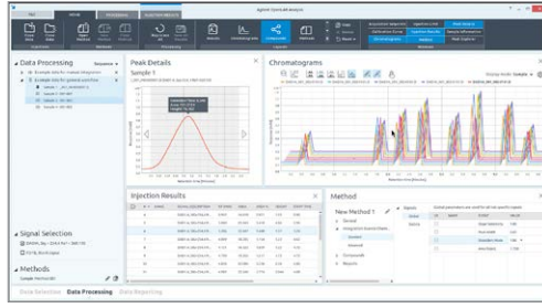
虚拟的讲师指导式培训