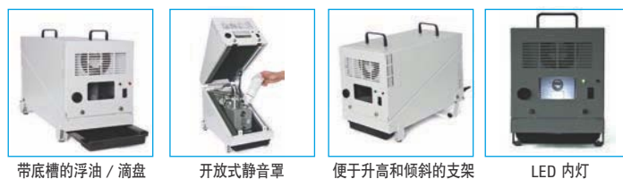
带底槽的浮油 / 滴盘