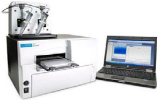
Figura 3. Lector multimodal Agilent BioTek Synergy HTX con el módulo inyector doble de reactivos Agilent BioTek.