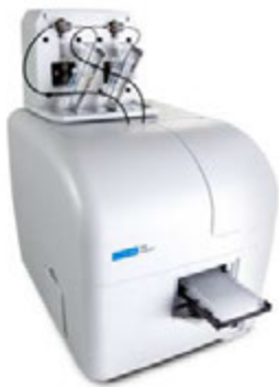
Figura 1. Módulo inyector doble de reactivos Agilent BioTek para el lector multimodal híbrido Agilent BioTek Synergy Neo2 (se muestra sin tapa).

La capacidad de realizar la inyección y medir o adquirir una imagen de una reacción con rapidez ofrece ventajas en numerosas aplicaciones de detección multimodal y adquisición de imágenes. Agilent pone a su disposición módulos inyectores dobles de reactivos para diversos sistemas de detección multimodal Agilent BioTek Synergy, así como para sistemas de adquisición de imágenes Agilent BioTek Cytation y Lionheart FX, a fin de facilitar y automatizar estas reacciones rápidas.