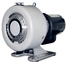
HLD BD30 配备 Agilent TriScroll 620 前级涡旋式干泵和相关连接硬件