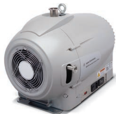
HLD BD15 配备 Agilent IDP-15 前级涡旋式干泵和相关连接硬件