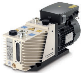
HLD BR15 配备 Agilent DS 302 旋片前级泵和相关连接硬件