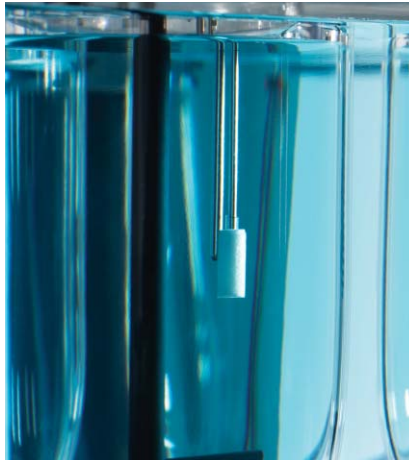
采用 Agilent 8000 工作站自动取样