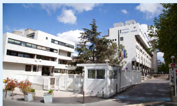
Hôpital Robert-Debré, Paris