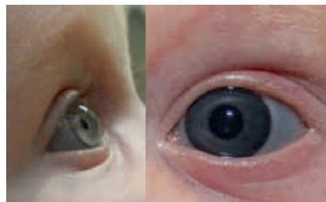
Abbildung 1: Auf dieser Abbildung werden der Habitus des Patienten und Nahaufnahmen des Keratoglobus und der blauen Sklera dargestellt.

Ein zwei Monate alter männlicher Säugling wurde aufgrund von Keratoglobus, Blaufärbung der Sklera und anomalem roten Reflex in den Augen (siehe Abb. 1) überwiesen. Die Familienanamnese ergab keine Hinweise auf diese klinischen Befunde und verwandte Erkrankungen. Die Hinweise der Anfangsdiagnose auf Brittle-Cornea-Syndrom (autosomal-rezessiv) oder Osteogenesis imperfecta (autosomal-dominant) dienten als Grundlage zur Identifikation von Kandidatengenen, die für den Phänotyp des Patienten verantwortlich sein könnten.