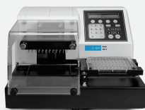
Agilent BioTek 自动化分液和处理