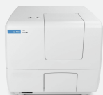
Agilent BioTek 微孔板检测仪