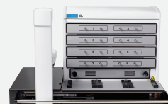
Agilent BioTek 微孔板自动化