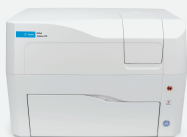
Agilent BioTek 细胞显微成像