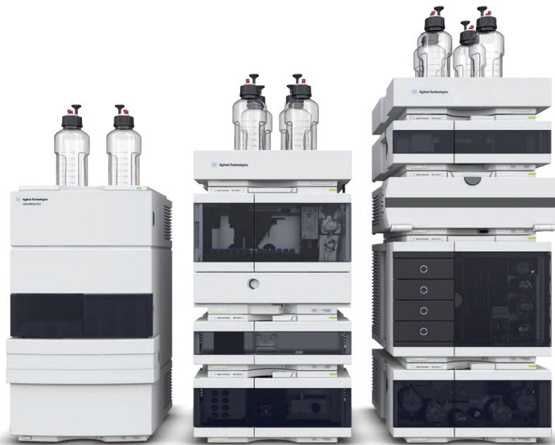
Agilent 1220 Infinity II LC

일상 분석부터 첨단 연구까지, Agilent InfinityLab LC 시리즈는 모든 응용 분야와 예산에 관계 없이 최고의 효율성을 달성할 수 있도록 적합한 폭 넓은 LC 시스템과 솔루션 포트폴리오를 제공합니다.