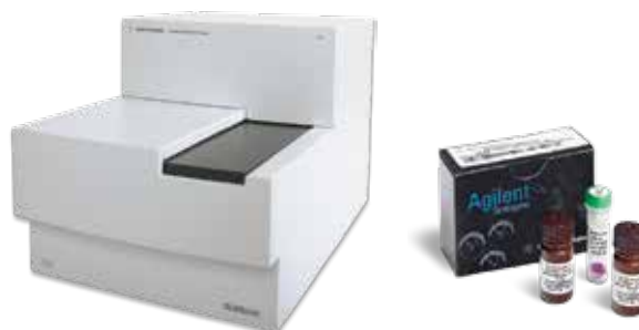
Os microarrays da Agilent fornecem sensibilidade superior e máxima flexibilidade de design com conteúdo definido ou completamente personalizável.