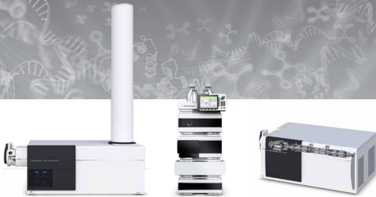
O Q-TOF Agilent 6550 (esquerda), combinado ao sistema HPLC 1260 (centro) é a escolha perfeita para descobrir metabolômicas, biomarcadores e pesquisa clínica. O espectrômetro de massas Agilent 6490 tripo quadrupolo (direita) fornece detecção ultrasensível, ideal para quantificação e análise de alvos.