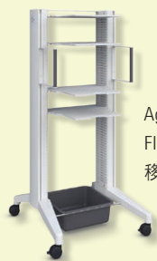
Agilent A-Line Flex Bench Rack 移动支架