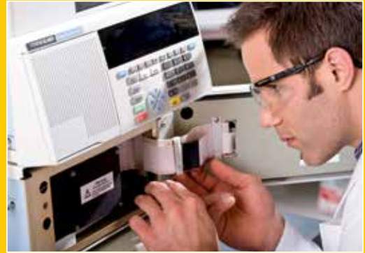
Los Servicios empresariales de Agilent le brindan una solución de servicio para todas las marcas populares de instrumentos.

El resultado, es un programa de servicio completo que optimiza la productividad al aumentar el rendimiento en toda su empresa de laboratorio.