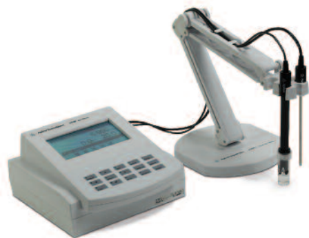
Medidor de iones 3200I, G4386A