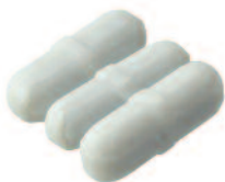
Barra de agitación B620, G4388-27000