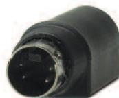
Herramienta de diagnóstico de control automático de la temperatura, 5185-8390