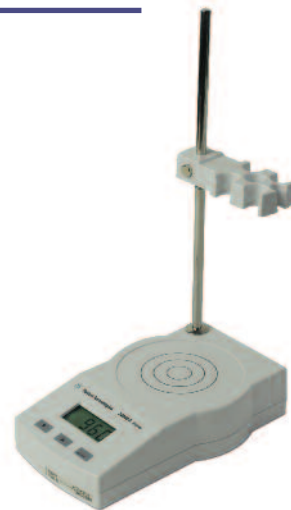
Agitador 3200SA, G4388A

*El software de impresión EC con el que puede imprimir de forma fácil y directa, y el software de firmware EC se pueden descargar de forma gratuita en www.agilent.com/chem/phmeters