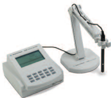
Medidor de oxígeno disuelto 3200D, G4385A

*Predeterminado, si no se indica lo contrario