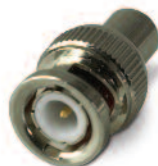
Enchufe de cortocircuito BNC-50J, G4383-40000