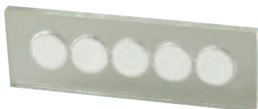
Membrana para electrodo de amoníaco, 5190-0543