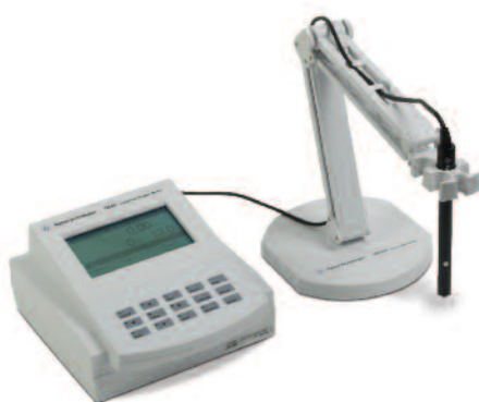
Medidor de oxígeno disuelto 3200D, G4385A