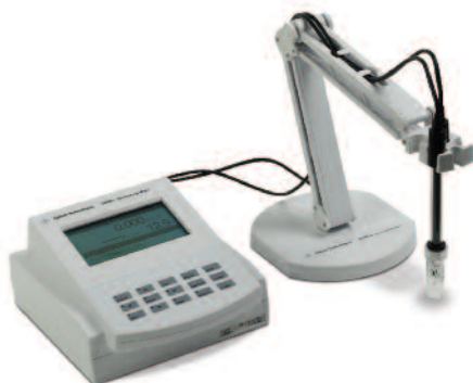
Medidor de conductividad 3200C, G4384A