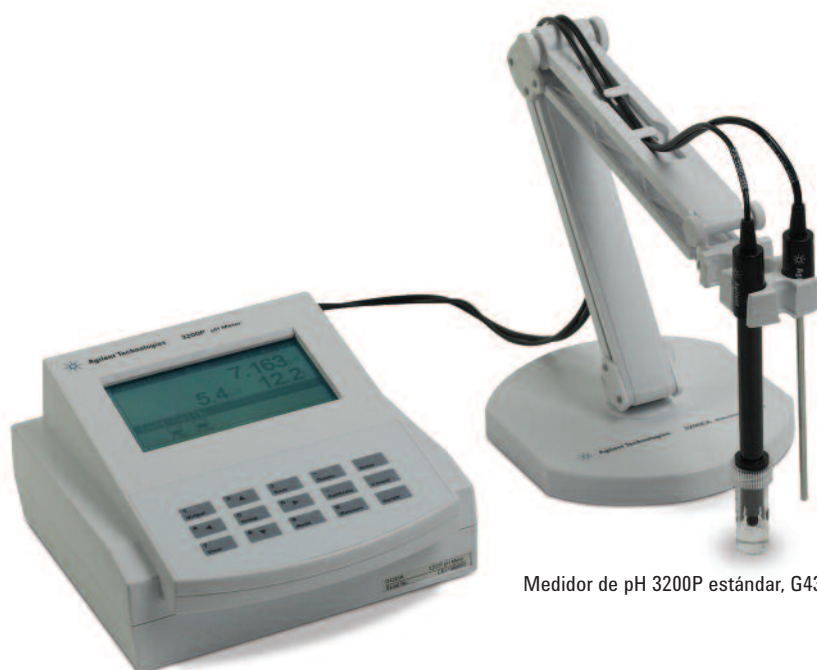
Medidor de pH 3200P estándar, G4383A