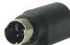
Herramienta de diagnóstico de la conductividad, 5185-8391