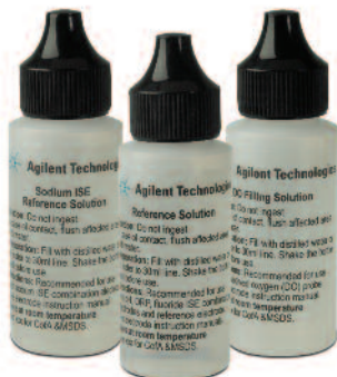
Soluciones Agilent de electrodo de referencia y de llenado