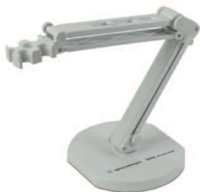
Portaelectrodo 3200EA, G4389A

A diferencia de los electrodos de membrana permeable de una sola capa, los electrodos de Agilent están fabricados con materiales multicapa que garantizan una mayor durabilidad. Además, también cuentan con una barrera específica para proteger la burbuja de vidrio contra rotura.