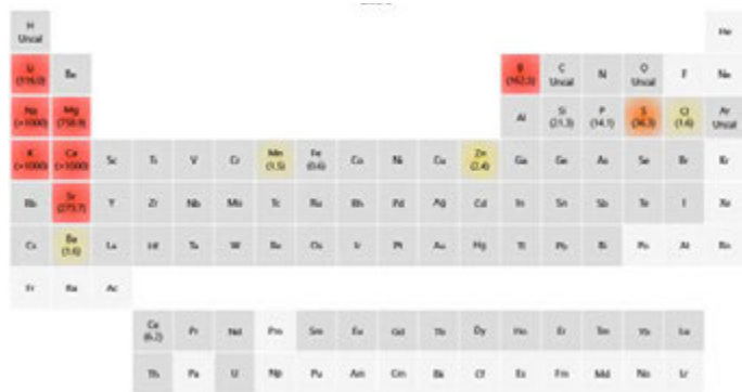
Figura 1. Mapa de calor IntelliQuant de una muestra de salmuera, que muestra las concentraciones relativas de los elementos de la muestra.

Se empleó el IntelliQuant Screening durante el desarrollo de métodos para determinar la concentración aproximada de los elementos en algunas de las muestras de salmuera. Esta información ayuda a determinar el intervalo de calibración y cualquier dilución necesaria. El software genera un mapa de calor en la tabla periódica para representar visualmente la concentración relativa de los elementos presentes en una muestra. Los elementos presentes en bajas concentraciones se muestran en amarillo, las concentraciones medias, en naranja, y las concentraciones altas, en rojo. En la Figura 1, se presenta un mapa de calor de una muestra de salmuera diluida.