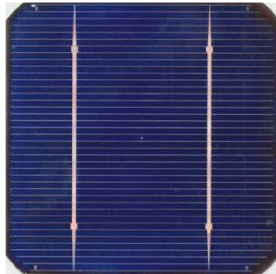
图 3. 装有金属接触格栅和防反射涂层的太阳能电池成品

此外，成品电池的平均反射光谱 (TS4, 采样区域包括电池表面和金属接触格栅) 与只有电池表面的反射光谱 (TS4 Diff ssk, 不包含反射性金属接触格栅的反射) 之间存在显著差异，这就突显了将光束尺寸缩小到足够小 (直径约 1 mm) 的