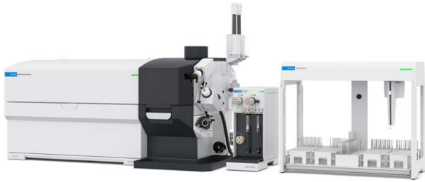
그림 1. AVS MS, ADS 2 자동 희석기 및 SPS 4 자동 시료 주입기를 포함한 Agilent 9500 ICP-QQQ.

시료 주입은 표준 마이크로미스트 유리 동심형 네블라이저, 온도 조절식 석영 스프레이 챔버 및 내경 2.5mm 주입기가 있는 석영 토치로 구성되었습니다. 니켈 도금된 구리 샘플링 콘과 니켈 스키머 콘을 인터페이스로 사용했습니다. 9500 ICP-QQQ는 AHM 및 에어 셀 가스 모드에 대한 기본 설정으로 작동되었으며 Agilent OpenLab ICP-MS 소프트웨어의 autotune 루틴을 사용하여 튜닝했습니다. 기기 작동 파라미터는 표 2에 나와 있습니다.