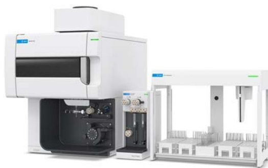
图 1. 配备集成 AVS 切换阀 (左)、Agilent ADS 2 (中) 和 Agilent SPS 4 自动进样器 (右) 的 Agilent 5800 VDV ICP-OES

所有测试均采用通过 Agilent ICP Expert Pro 软件进行操作的 5800 VDV ICP-OES。5800 ICP-OES 的垂直炬管可确保长时间稳定地测试各种样品（包括可使用 EPA 6010D 方法运行的复杂多样的土壤样品）。另外，仪器先进的 VistaChip III 检测器提供了高速连续波长覆盖，使分析人员可以为每种元素选择多个波长，而不会增加分析的时间延迟。