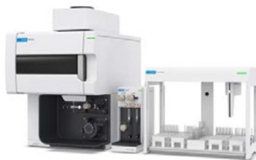
Abbildung 1. Agilent 5800 VDV ICP-OES mit integriertem AVS Schaltventil (links), Agilent ADS 2 (Mitte) und automatischem Probengeber Agilent SPS 4 (rechts).

Alle Messungen wurden mit dem 5800 VDV ICP-OES durchgeführt, das mit der Agilent ICP Expert Pro-Software betrieben wurde. Die stehende (vertikale) Fackel des 5800 ICP-OES gewährleistet robuste Messungen über erweiterte Zeiträume hinweg für eine breite Palette von Proben einschließlich hoch variabler Bodenproben, die mit der EPA-Methode 6010D analysiert werden können. Darüber hinaus ermöglicht der hochentwickelte VistaChip III-Detektor mit schneller, kontinuierlicher Wellenlängenabdeckung es dem Analytiker, ohne Zeitverzögerungen bei der Analyse mehrere Wellenlängen für jedes Element auszuwählen.