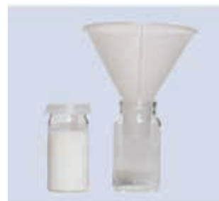
Figure 2. Kit disponible pour mesure de type A selon la norme 3 de la CEAC.